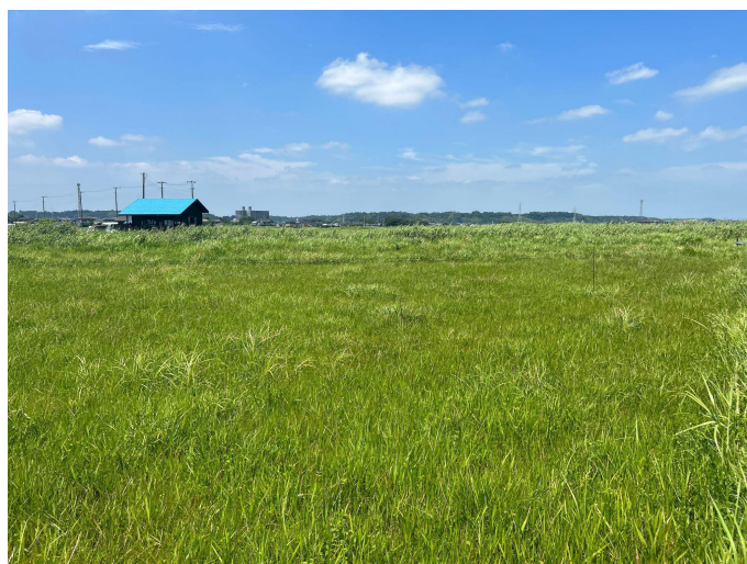
成東・東金食虫植物群落(国指定天然記念物)

山武市百年後芸術祭では、この土地が持つ歴史と地形に沿ったコンセプトを基盤に、アート作品と音楽パフォーマンスが展開され、訪れた人々に100年後を考えるきっかけとなることを願っています。