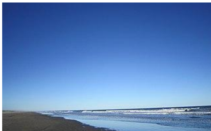
九十九里浜(県立自然公園)